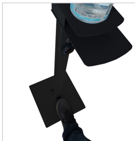
Commande au pied