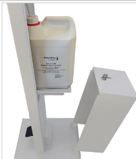
Grande autonomie avec bidon de 5 L