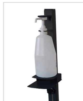
Compatible 1 L

Commande non annulable. Le traitement de vos demandes et les délais de livraison peuvent être allongés. Merci pour votre compréhension.