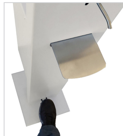
Commande au pied

Commande non annulable. Le traitement de vos demandes et les délais de livraison peuvent être allongés. Merci pour votre compréhension.